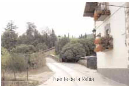
Puente de la Rabia