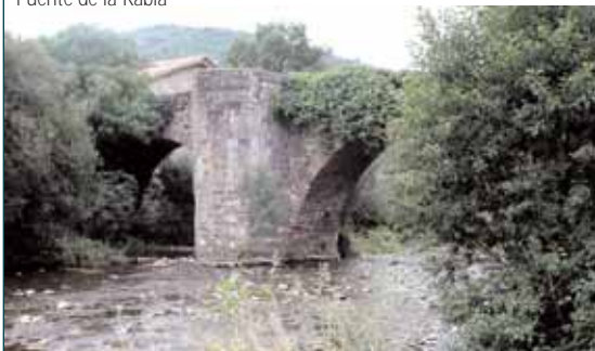
Puente de la Rabia