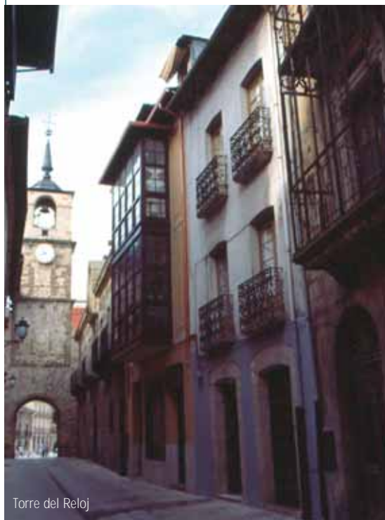
Torre del Reloj

GUÍA DEL CAMINO DE SANTIAGO PARA PERSONAS CON DISCAPACIDAD